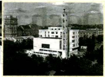
Kostel Stavbu Husova sboru na Vinohradech projektoval Pavel Janák, jedna z nejvýznamnějších osobností české architektury první pol. 20. století.